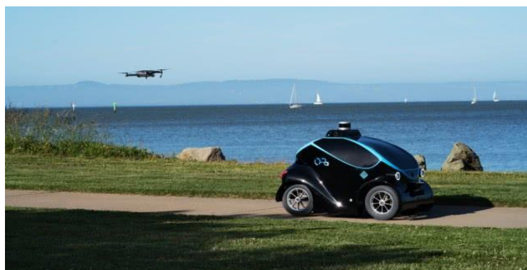
图 4 地空协同安保机器人

无人机和地面移动机器人配合，可以扩展机器人对环境感知的能力，提高机器人工作效率，见图 4。