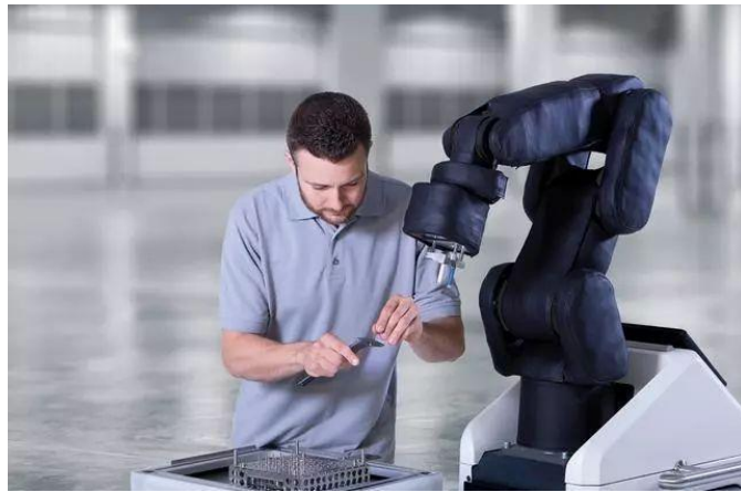
图 1 协作机器人 APAS

人机协作机器人，与必须用安全护栏与人隔离的传统工业机器人不同，它可以和人在共同工作空间中协作、互动，一起完成工作。2014 年 10 月，博世(Bosch)推出了其首个协作机器人解决方案 APAS,它是协作机器人中很早获得认证的助理系统,可以协助人类工作,且无需任何额外的防护，如图 1 所示。APAS 的黑色皮外套装有触觉传感器。在机器人和人类一起工作时，这些传感器能够检测到接触产生的非常规力，并给控制器提供一个即时反馈。同时，机器人还有安全距离保护，当检测到人靠得太近时，也会自动降低运行速度；在人离开该区域后，机器人会自动恢复正常速度，相当于隐形的防护网。