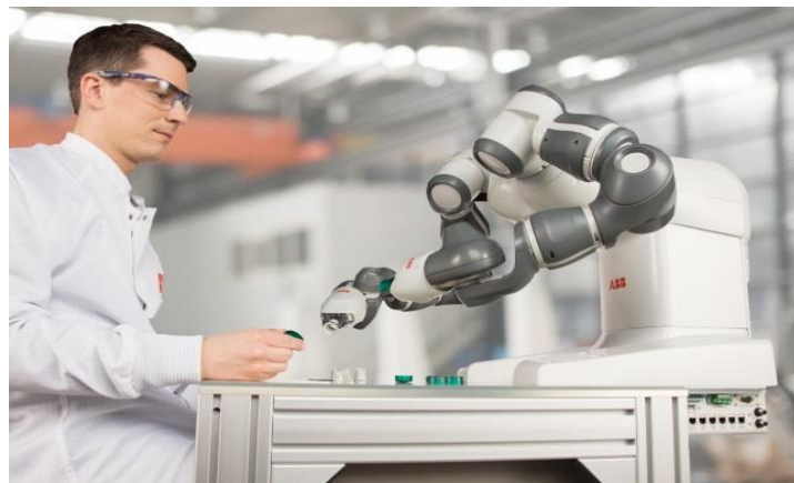
图 2 双臂协作机器人 YuMi

ABB 公司也有一款双臂协作型机器人,名叫 YuMi。作为一款人性化设计的双臂机器人, YuMi 使小件装配等自动化作业进入一个全新时代。工人和机器人可以和谐共处,共同完成同一个任务如图 2 所示。YuMi 在英文中是“你和我”协同工作的简称。这样的协作系统让机器人完成制造任务中那些繁琐的重复动作,而让专业人员专注于核心需求。